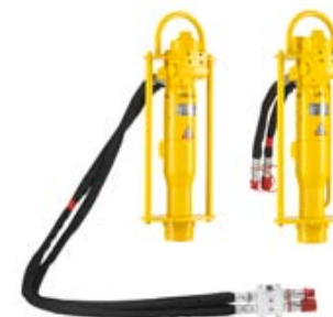
Молотки для забивания столбов

Эти молотки способны выдерживать высокое противодавление в обратной линии. Поэтому их можно подключить практически к любому источнику гидравлической энергии, даже к погрузчику. Они прекрасно подходят также для случаев, когда используется гидравлический рукав большой длины.