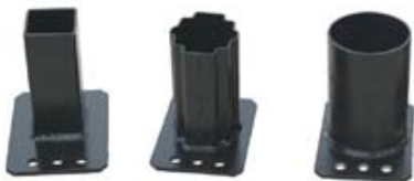
Адаптеры для моделей LPD-T и LPD-RV