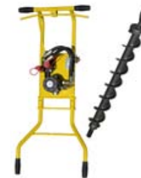
Переносной бур скважин для столбов

Компактный и эффективный инструмент для бурения скважин в твёрдой и песчаной почве глубиной до 1,3 м и диаметром 90-350 мм. Рабочий инструмент может вращаться в обратном направлении, предназначен для использования двумя операторами. Все буры имеют заменяемые наконечники, что обеспечивает их длительный срок службы. Прекрасно подходит для установки ограждений и высаживания деревьев. Инструмент имеет двухсторонний ход и регулируемый крутящий момент, благодаря этим особенностям его можно использовать для открывания и закрывания больших водных вентилей, например, установив специальный адаптер.