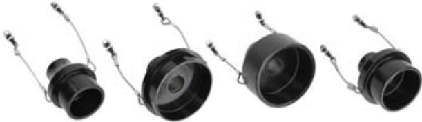
Цельные адаптеры для моделей LPD-HD-T и LPD-HD-RV