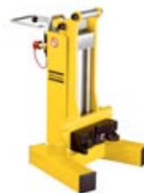
Установка для извлечения столбов

Представленные компанией Atlas Copco установки для извлечения столбов используются дорожными подрядчиками для демонтажа повреждённых ограждений и знаков. Оборудование оснащено закалёнными захватами и автоматическими тисками с цепным натяжением, прекрасно подходит для удаления всех видов деревянных и стальных опор, в том числе профилей IPE, HPE, UPE и стальных труб круглого и квадратного сечения. Установка развивает гидравлическое тяговое усилие 6 тонн. С помощью дополнительного рычага (опция) тяговое усилие может быть увеличено ещё на 4 тонны, что позволяет без труда освободить любые крепко зафиксированные опоры. Установка весит 60 кг и является самой компактной и мобильной из предлагаемых на рынке – прекрасное решение для ремонтных работ в местах, не доступных для 10-тонного крана.